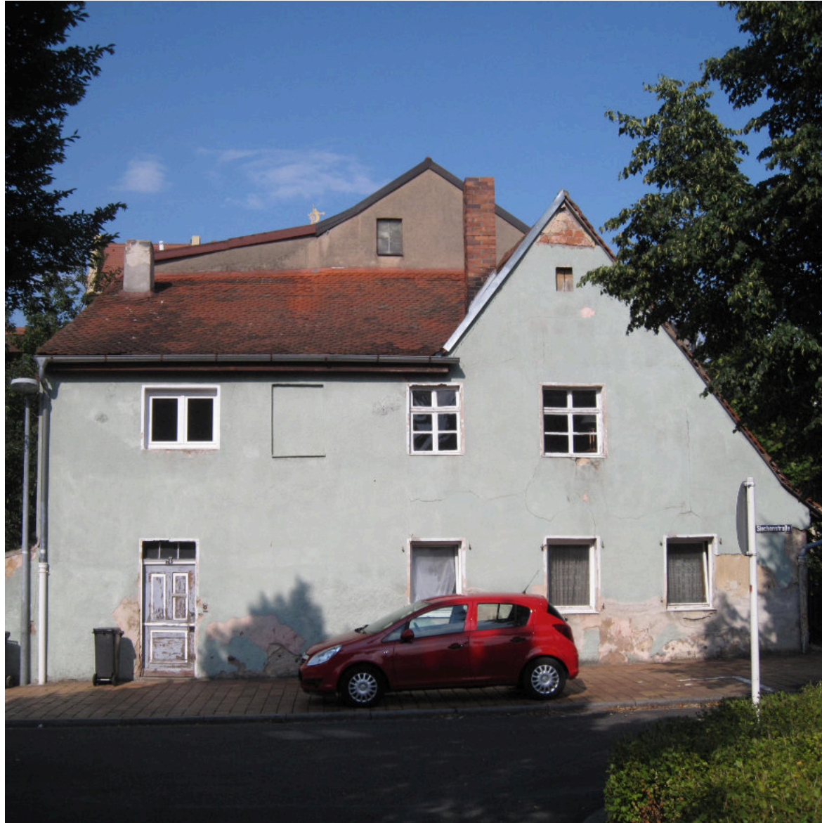
Verfall durch Leerstand (wie hier an der Hallstadter Straße) kann über eine Zweckentfremdungssatzung eingedämmt werden.