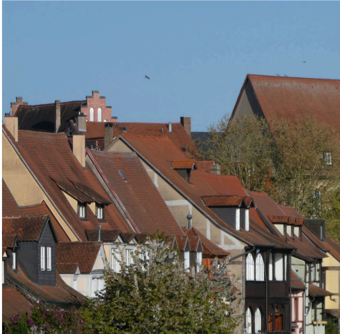
Bamberg's intakte Dachlandschaft, wesentlicher Teil des Wertes der Altstadt.