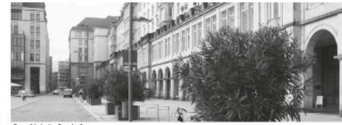
Rep. Altstadt - Seestraße