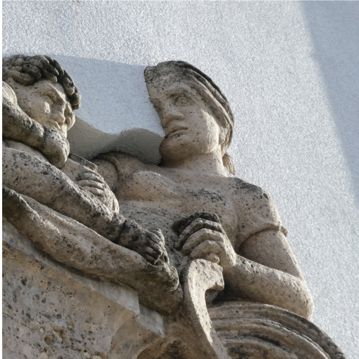
Nicht immer werden Dämmungen altbaugerecht durchgeführt. Ein Beispiel von der Sparkasse am Heinrich-Weber-Platz.