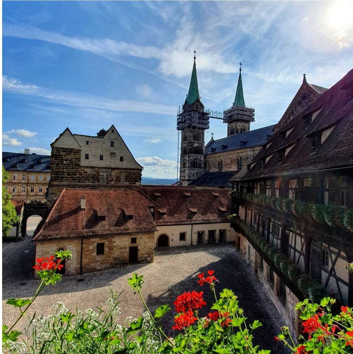
Bamberg's faszinierende Geschichte verdient ein Stadtmuseum.