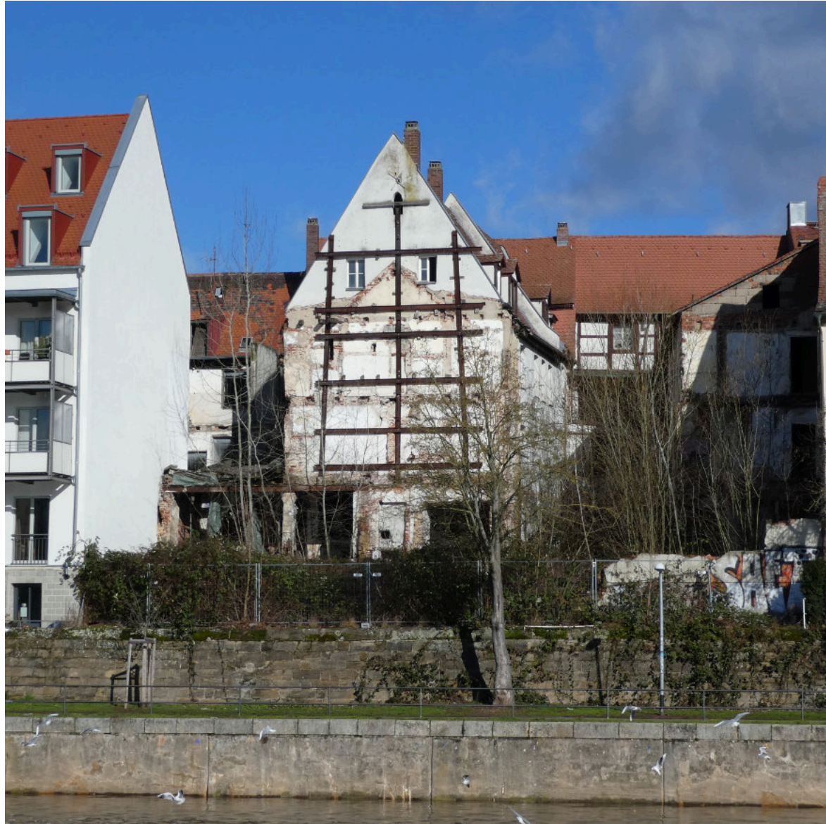
In seiner Bedeutung kaum bekannt: Das mittelalterliche Kontor, flussseitiges Rückgebäude des Roten Ochsen.