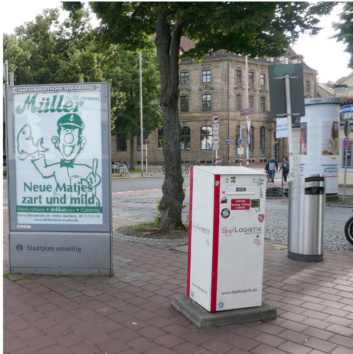
Lasst uns unsere Stadt (noch) schöner machen!