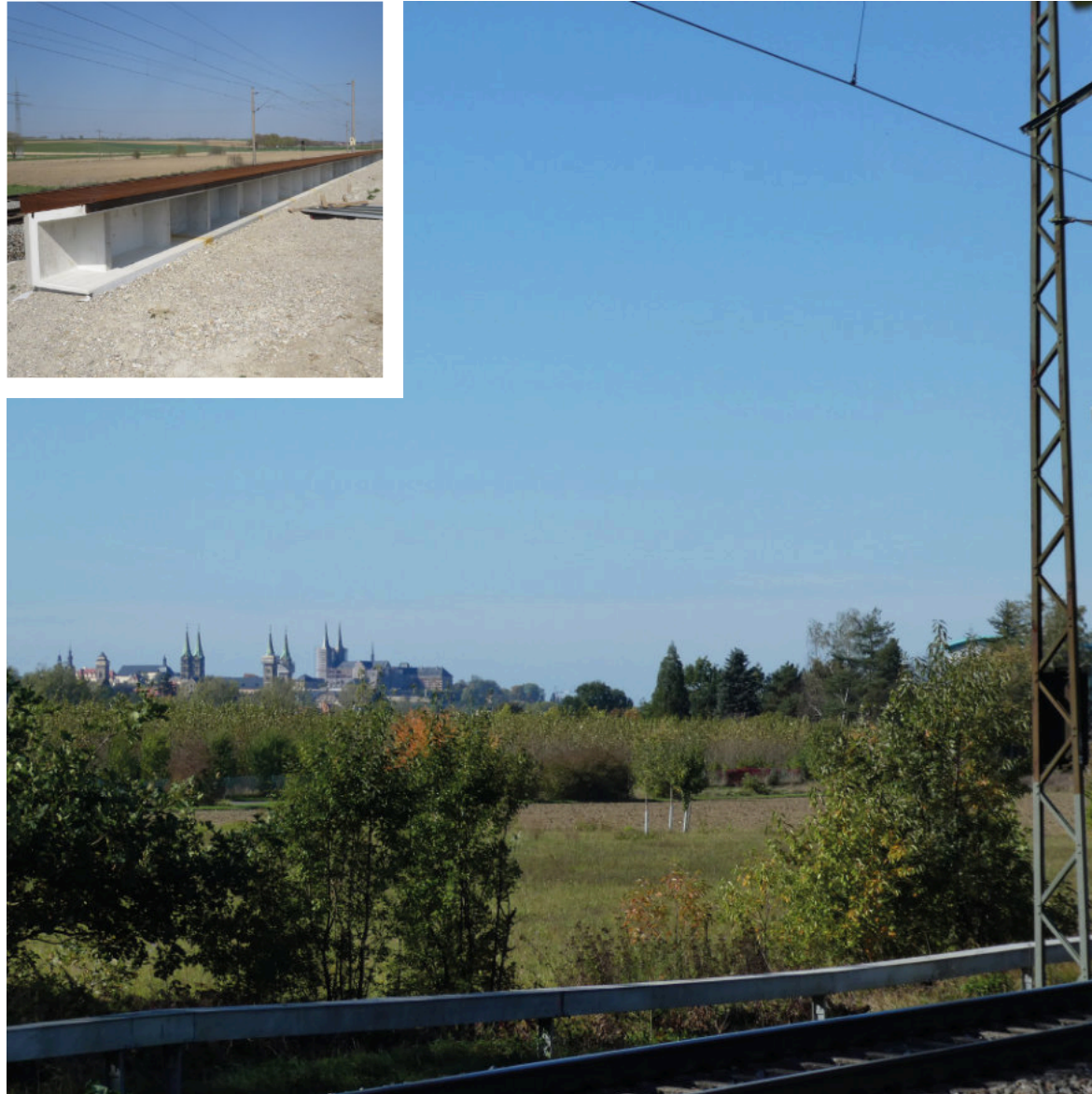
Bald mit Mauern verbaut? Aussicht in der Südflur. Oben: Niedriger Lärmschutz in der Schweiz