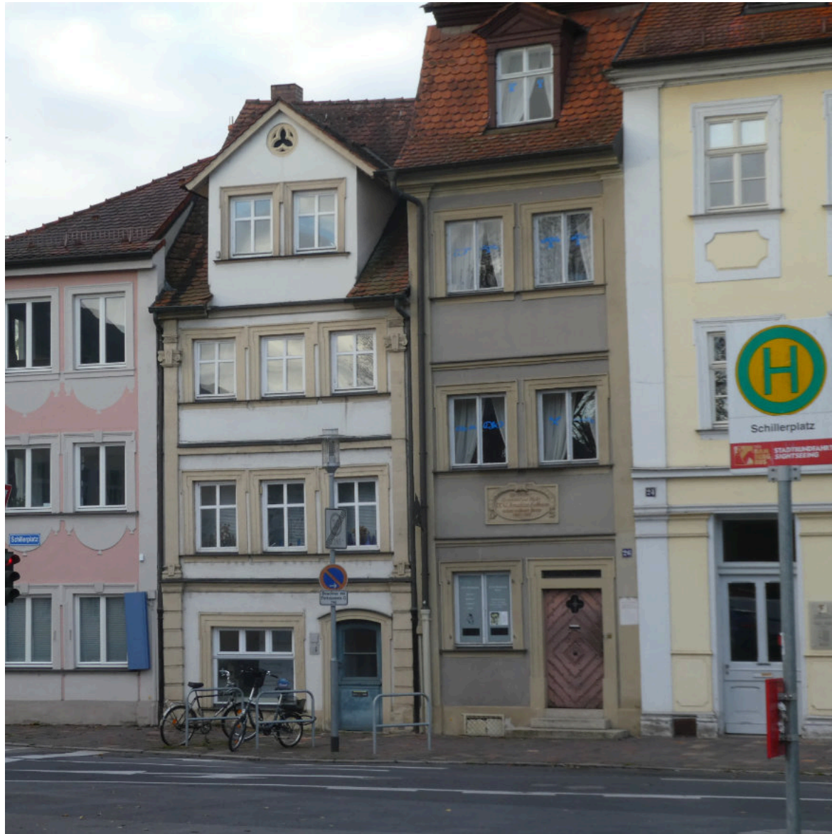
Bescheidenheit als Wesensmerkmal: Das E.T.A.-Hoffmann-Haus.