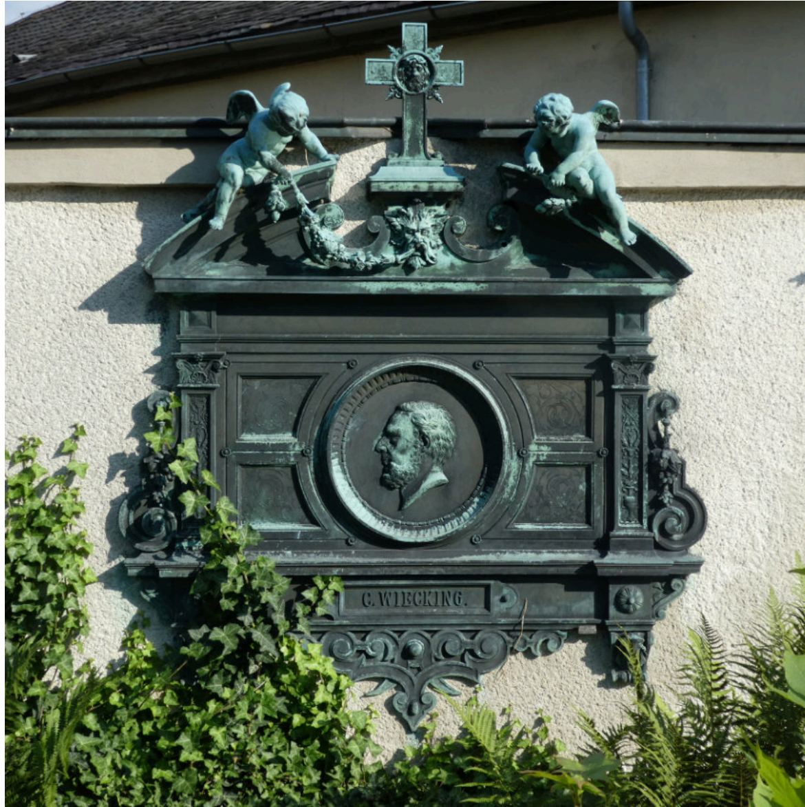
Wunderschöne Grabmale verdienen es, erhalten zu bleiben.