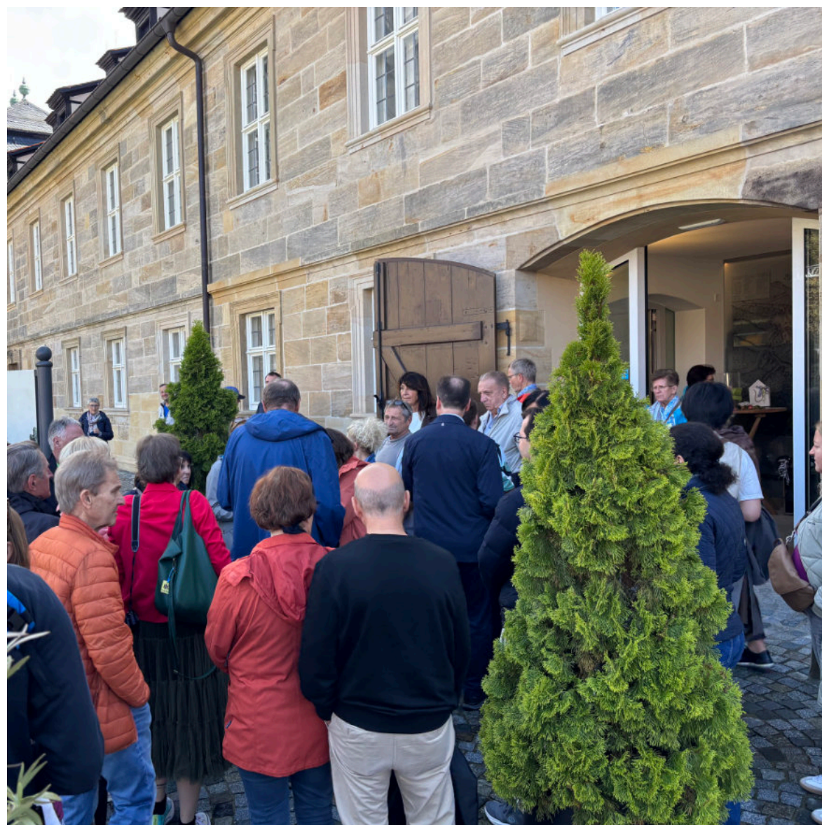
Andrang bei den städtischen Liegenschaften am Tag des offenen Denkmals.