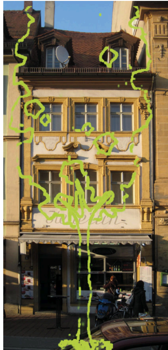
Beispiele für unpassende Standorte von Baumneupflanzungen aus der Planung für die Lange Straße: Wertvolle Fassaden würden verdeckt.