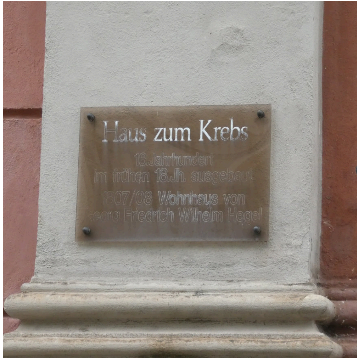
Eine etwas verblasste Errungenschaft: Infotafeln an Bamberger Denkmälern.