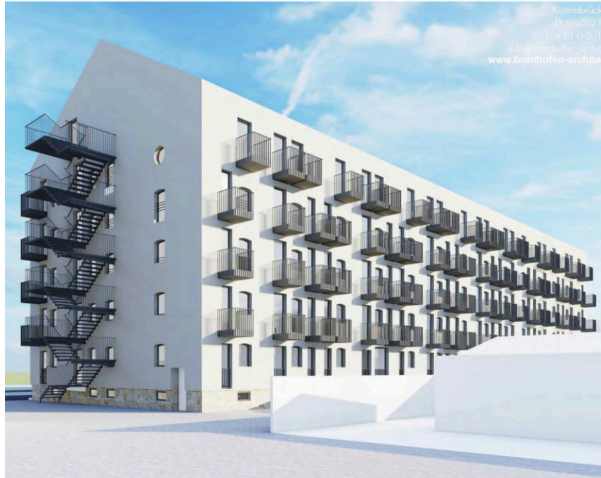
Unpassender Entwurf für den ehemaligen „Schauer“ aus dem Jahr 2020, verhindert durch den Stadtgestaltungsbeirat (Bornhofen Architekten).