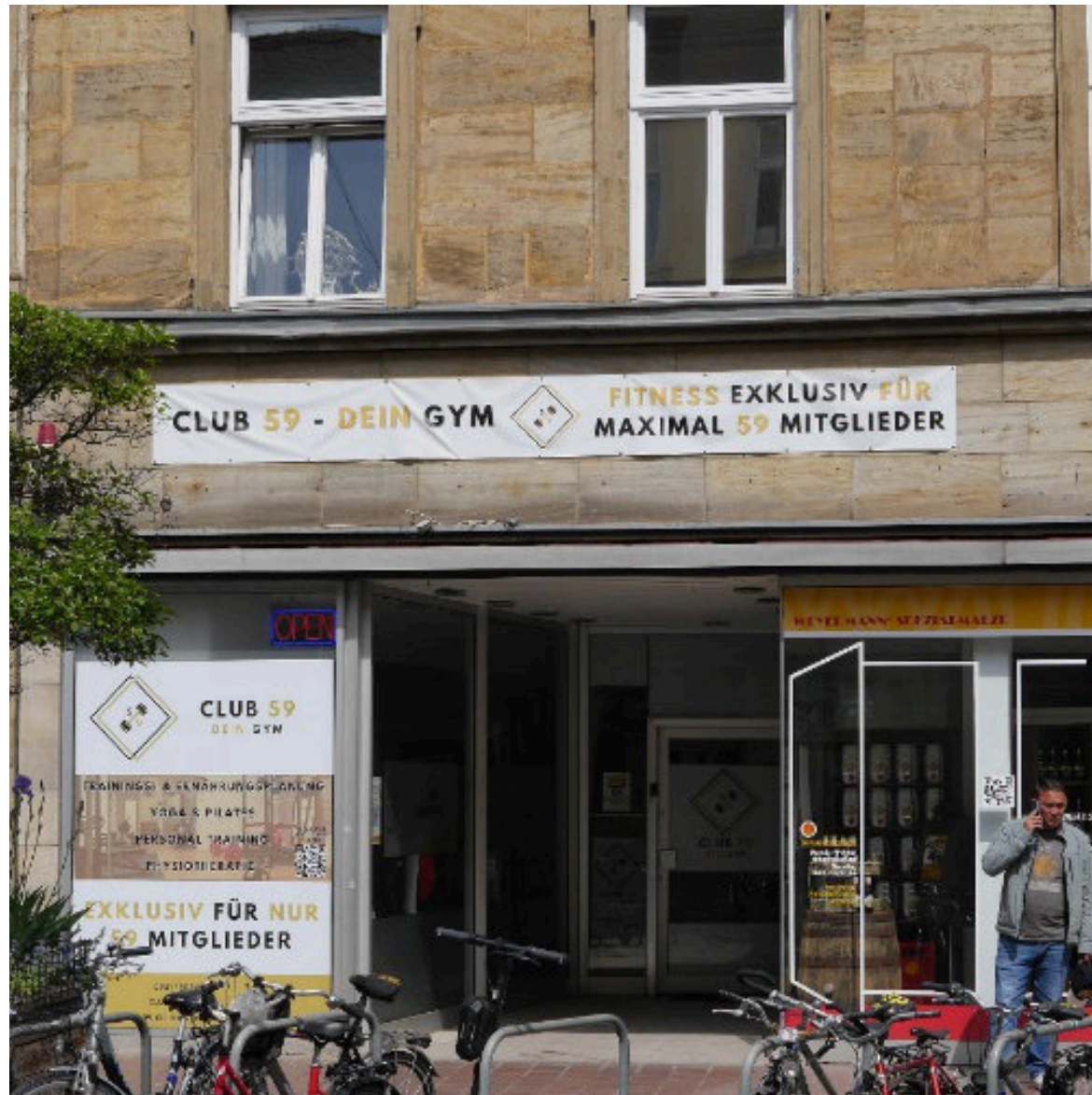
Ödes Erdgeschoss, Banner, verklebte Schaufenster ohne Rücksicht aufs Denkmal und Straßenbild der Altstadt: ein Negativbeispiel von vielen.