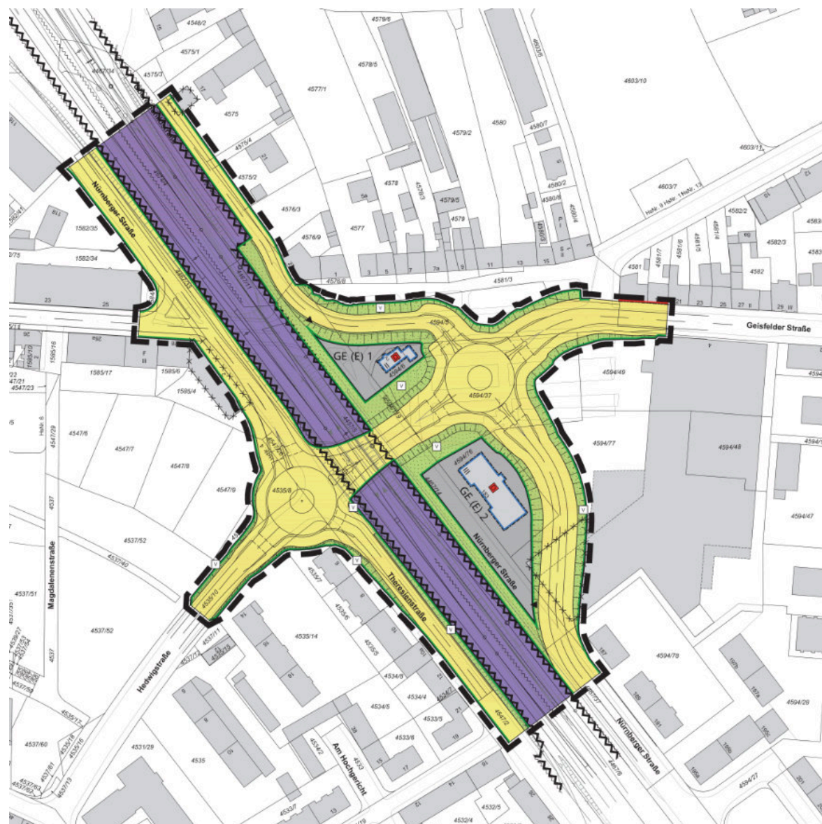
So viel Ärger für wenig Nutzen: Doppelkreisel an der Geisfelder Straße