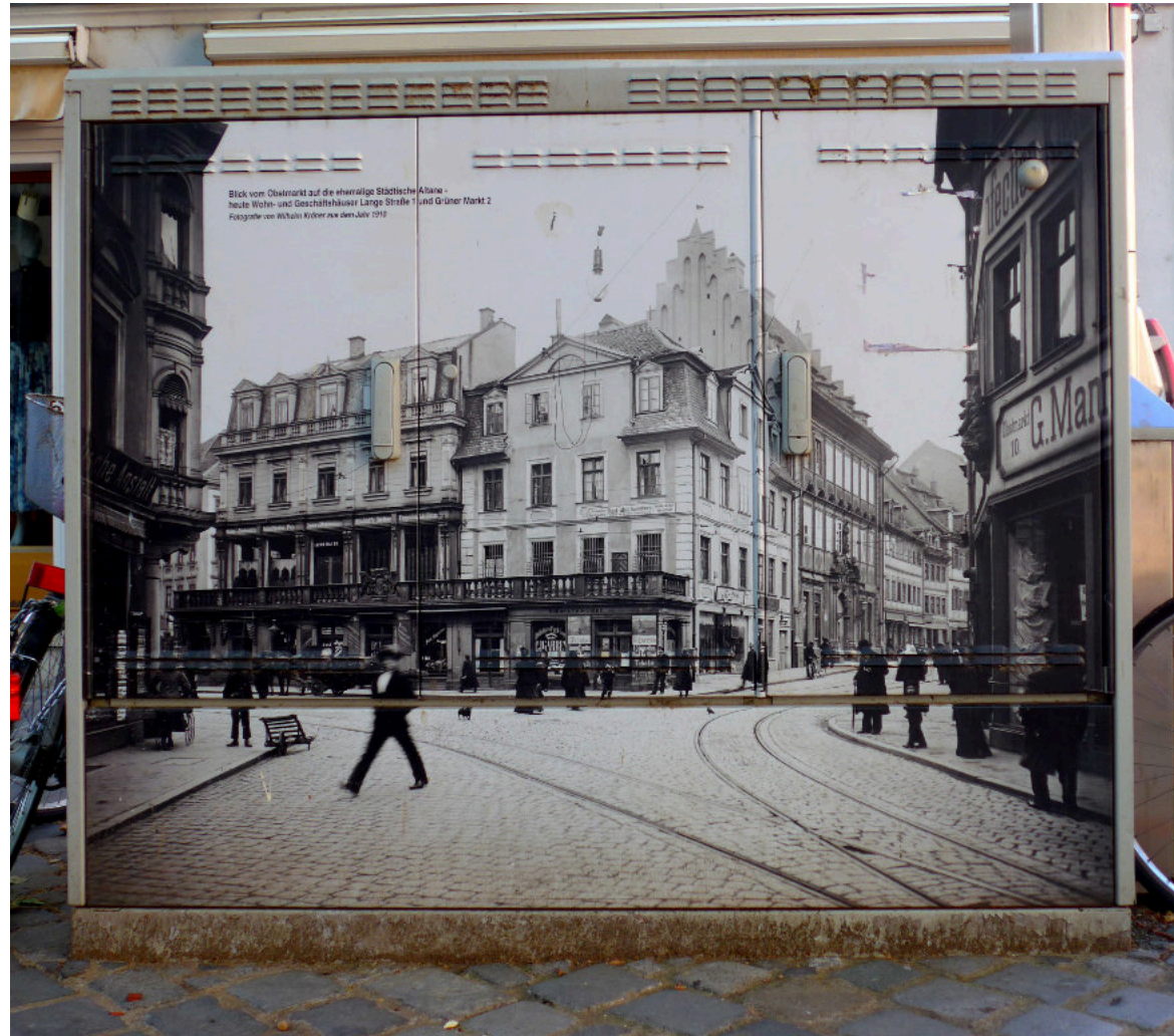
Vorbildhafte Gestaltung eines Verteilerkastens an der ehemaligen Altane zwischen Langer Straße und Gabelmann.