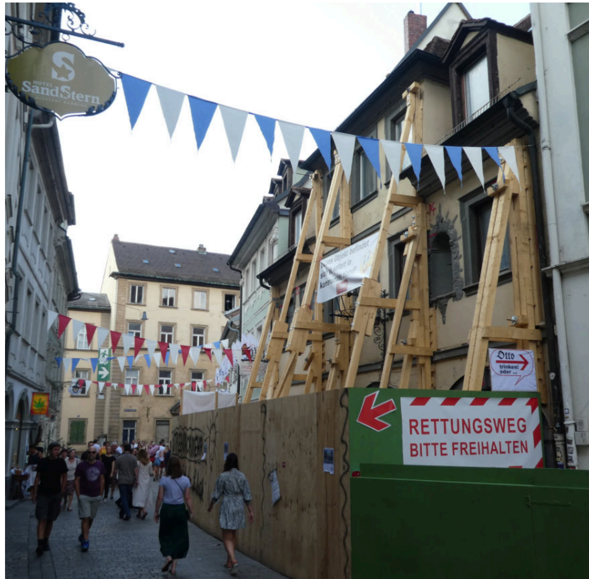
Spektakuläre Rettungsaktion 2019. Seither wartet das „Sound ‘n Arts“ auf eine Rückkehr in ihre Kellergewölbe.