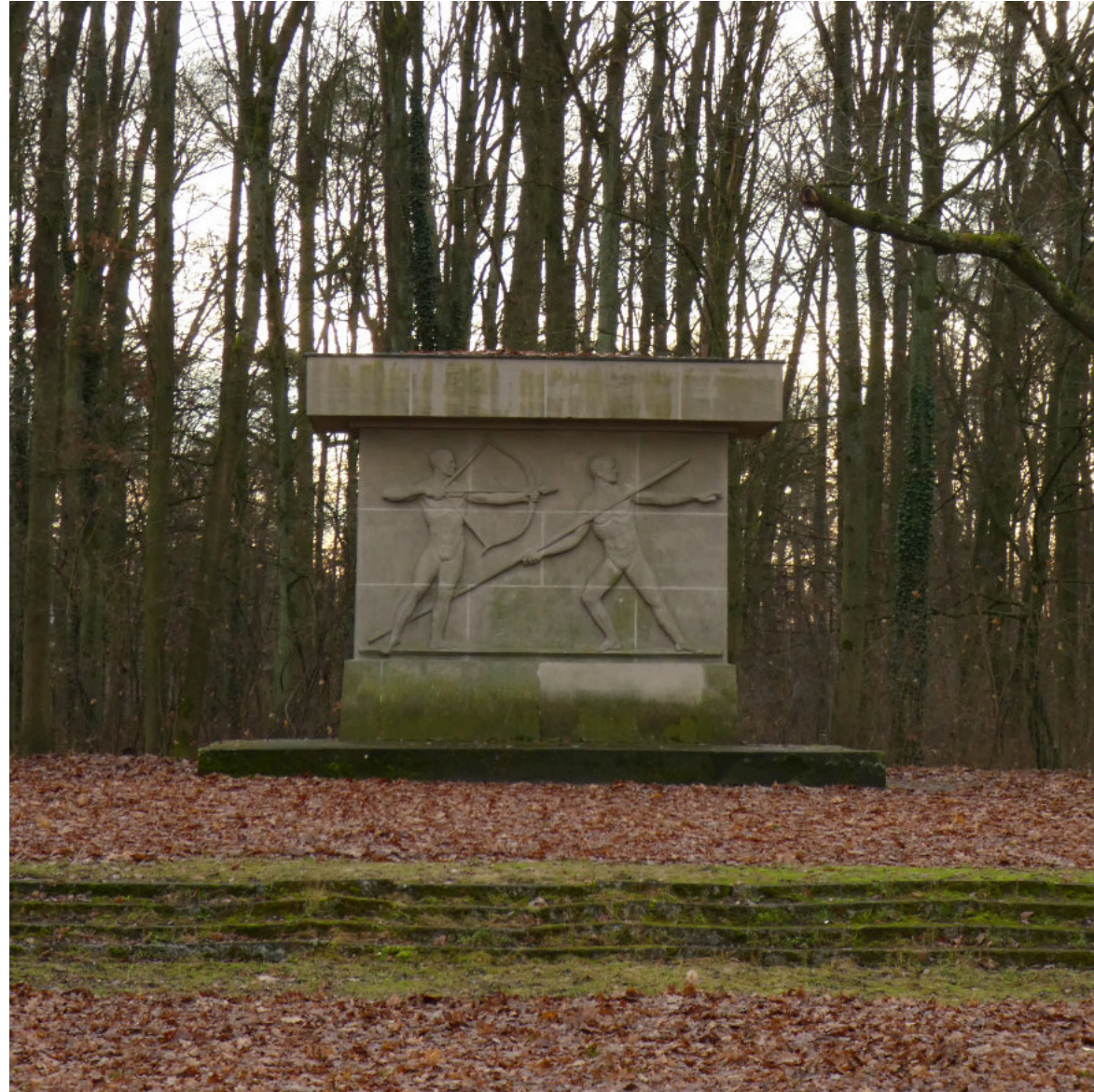
Der Volkspark im Dornröschenschlaf. Er könnte wieder zu einem Gewinn für die ganze Stadt werden!