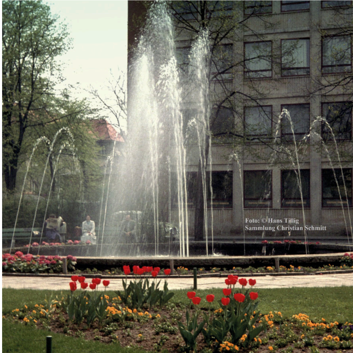
Wie beeindruckend waren einst die Fontänen am Schönleinsplatz (Foto: Hans Tillig aus der Sammlung Christian Schmitt).